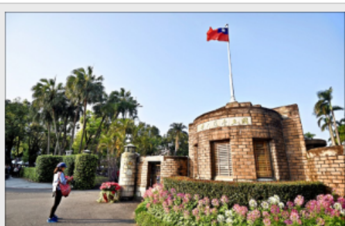
台灣大學、台灣師範大學、台灣科技大學共同合作，陸續通過各校教務會議，將推出跨校修輔系。(資料照)

〔記者吳柏軒／台北報導〕台灣大學、台灣師範大學、台灣科技大學共同合作，陸續通過各校教務會議，將推出跨校修輔系，讓校內學生更多跨域學習機會，畢業證書可互相標註，但仍須報教育部核備，預計今年八月的一○八新學年起實施，未來不排除朝跨校雙主修邁進。