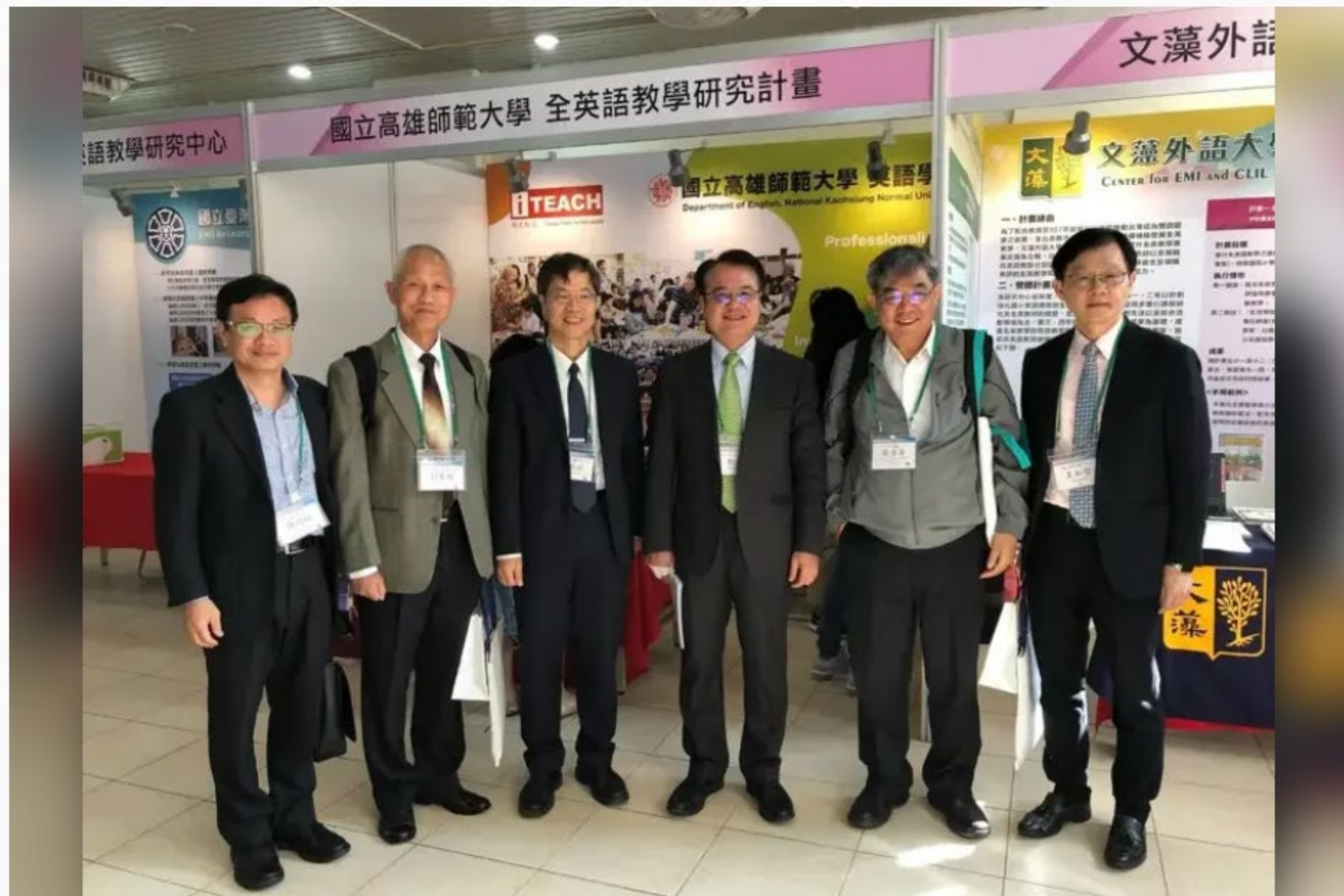
教育部辦全英語教學研究中心成果研討會，分享中等學校、國民小學全英語教學課程內涵及教學模組研發成果。